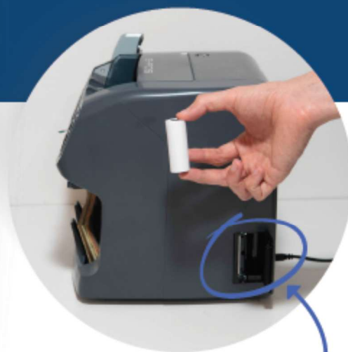
Impresora térmica integrada

A diferencia de las contadoras tradicionales, esta máquina tiene múltiples formas de clasificar billetes, detecta falsificaciones con tecnología avanzada y agiliza el conteo con doble bandeja, evitando interrupciones y retrabajos.